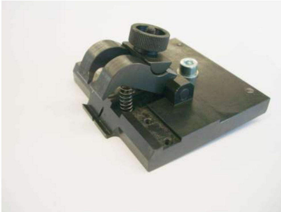
Spannvorrichtung 377.17.140.00 für kleine Werkstücke \varnothing 0,5 – 6mm