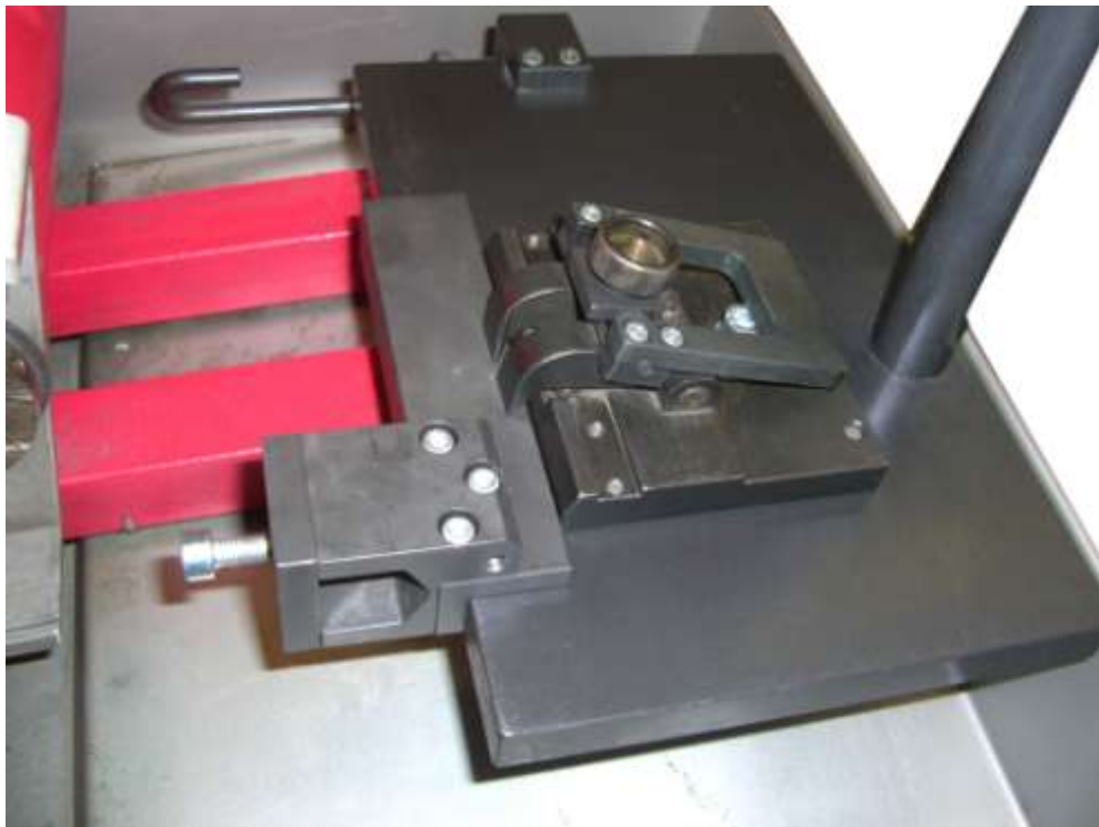
Spannvorrichtung 377.17.180.00 und 377.17.185.00 zum Spannen von runden Werkstücken bis \varnothing 25mm.