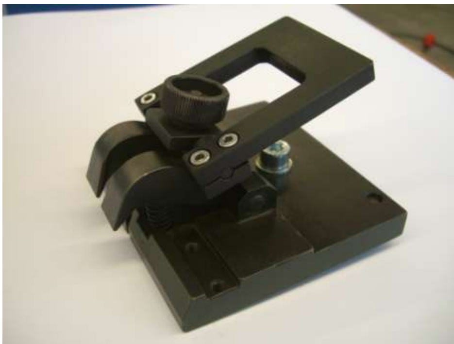
Schnellspanner 377.17.070.00 zum schnellen Spannen der Werkstücke