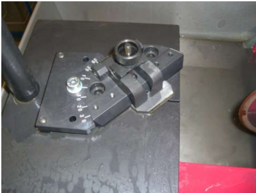
Spannvorrichtung Schrägschnitt 377.17.150.00 zum Trennen der Werkstücke mit einer Schräge bis 45°