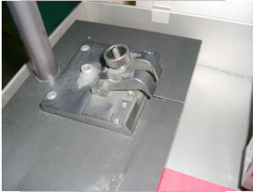
Drei-Punkt -Spannvorrichtung 377.17.060.00 für zylindrische und flache Werkstücke